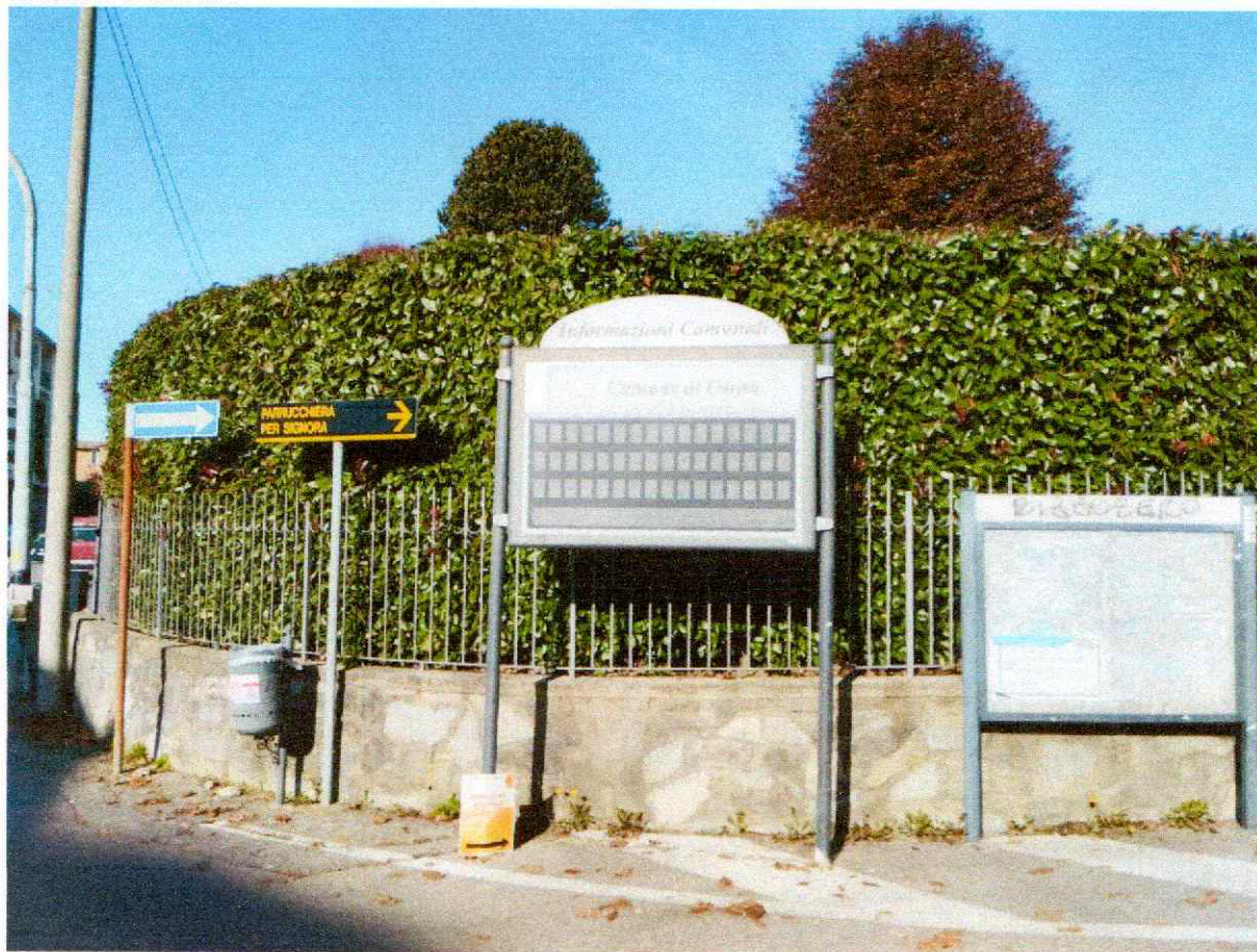
VIA MILANO VICINANZE SYNLAB