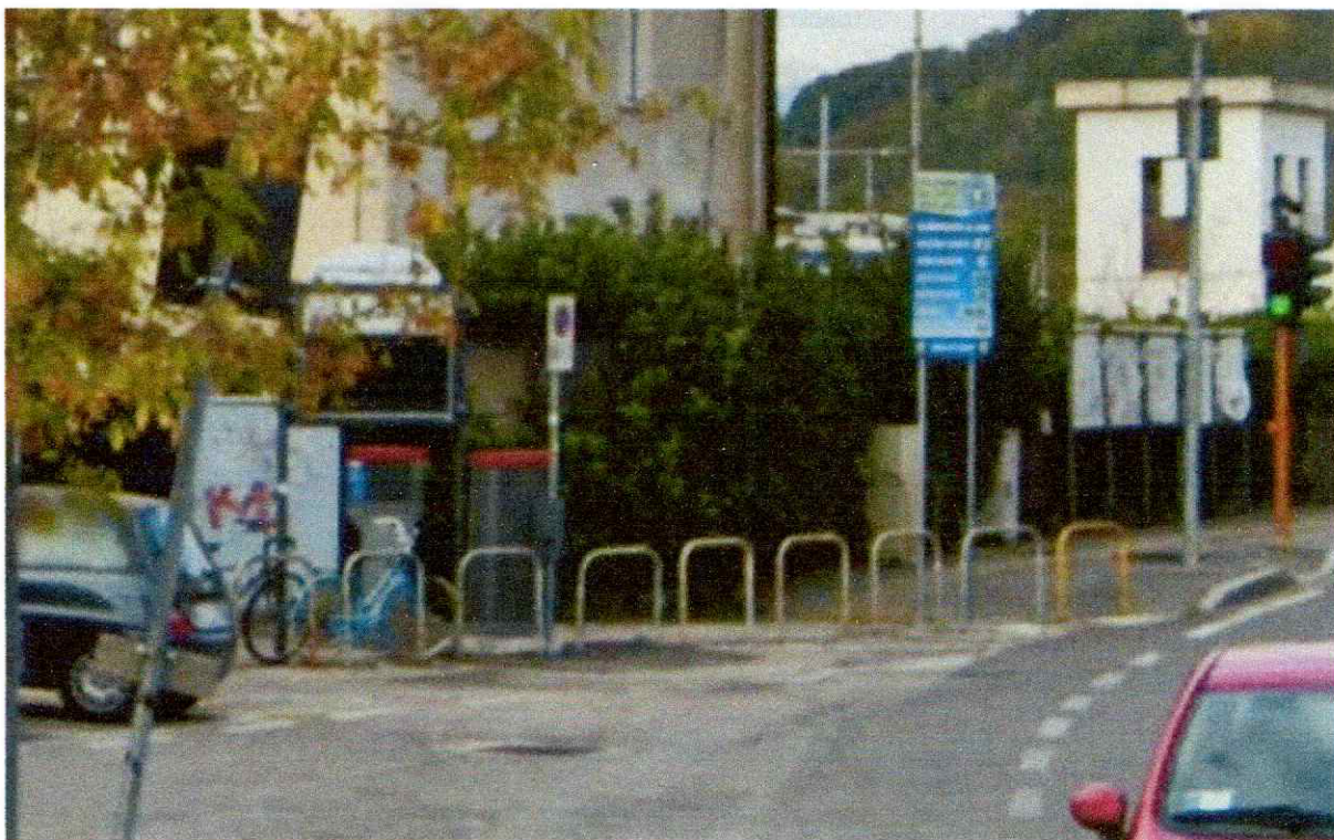
CANTU' ASNAGO – PIAZZALE DELLA STAZIONE