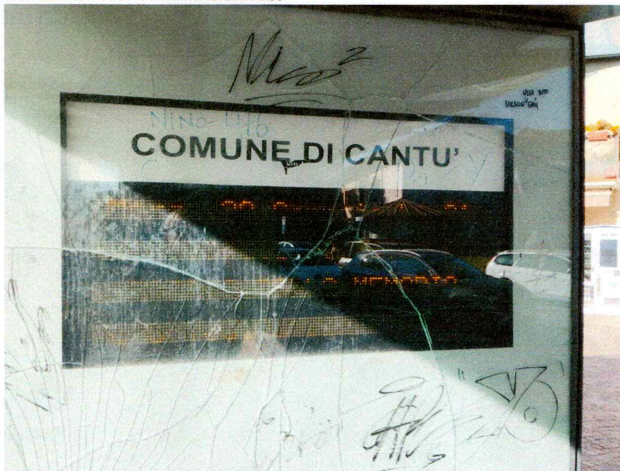
VIGHIZZOLO PIAZZA PIAVE PENSILINA BUS