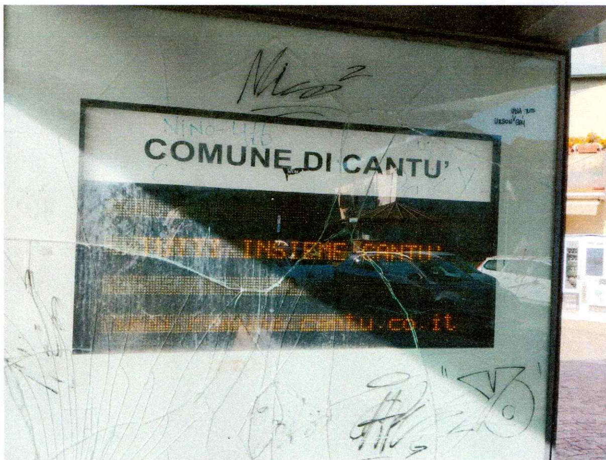
VIGHIZZOLO PIAZZA PIAVE PENSILINA BUS