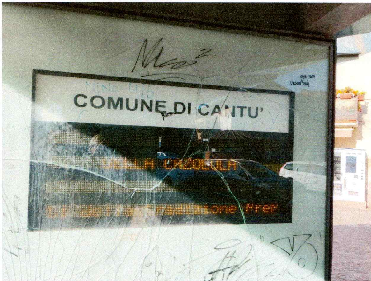
VIGHIZZOLO PIAZZA PIAVE PENSILINA BUS